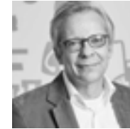
Frank de Grave Lid Raad van State, voormalig voorzitter Federatie Medisch Specialisten en Neder- landse Zorgautoriteit